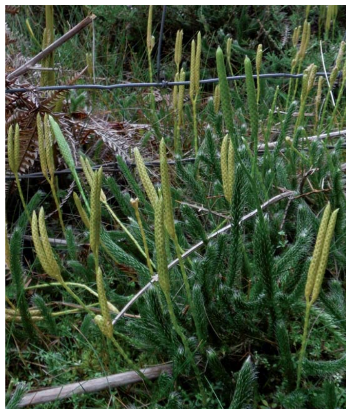
Lycopode en massue sur la lande du Puy la croix

http://www.creuse.gouv.fr/Politiques-publiques/Environnement/Protection-de-la-nature-et-de-la-biodiversite/Natura-2000-Evaluation-des-incidences